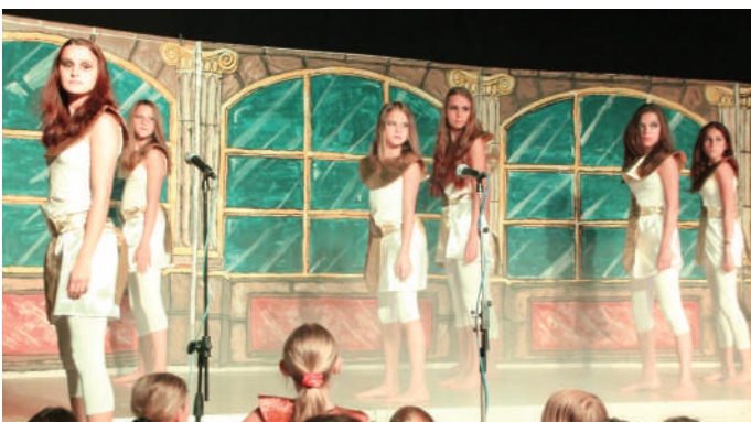
Beeindruckende Performance: Bei der Ägypterproduction hielten viele Zuseher die Luft an.