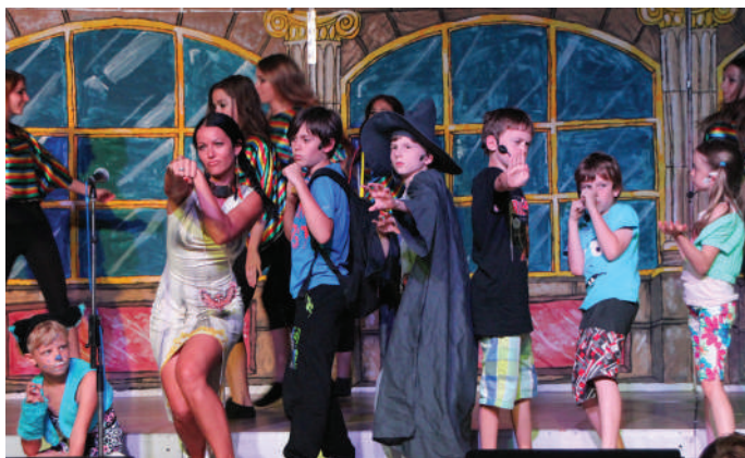
Die Kinder haben professionelle Verstärkung bekommen und sind nun die glorreichen Sieben.