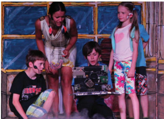
In vino veritas: Der Computer entschlüsselt den Kindern einen eher unüblichen Zauberspruch – aber er funktioniert.