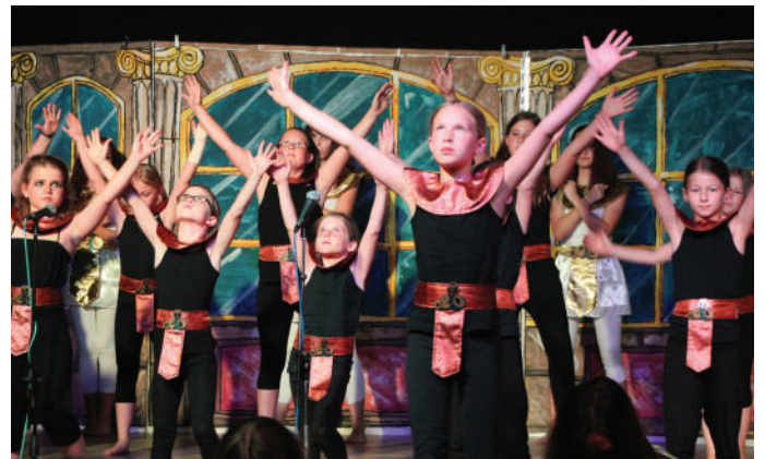
Deliver us: Gänsehautfeeling in der Ägypterproduction