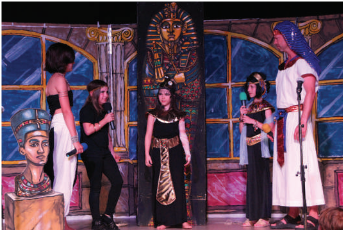
Anchesenamun (Bianca) ist erwacht und will sich ihre schrecklichen drei Wünsche erfüllen. Mit dabei die Akaris (Daisy, Carmen, Rici) und Nasir (Andrew)

Vier mutige Kinder machen sich auf die Suche nach dem Schatz der Anchesenamun, um ihre Elternhäuser zu retten. Dabei erleben sie allerlei Abenteuer und bekommen magische Unterstützung. Grusel, Spannung und tolle Unterhaltung mit genialen Gesangs- und Tanzeinlagen erlebten die Besucher bei den drei Vorstellungen. Absolut beeindruckend waren auch die selbst gestalteten Kulissen.