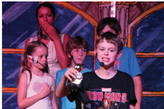
Die Kinder stoßen auf den größten Diamanten der Welt – die Finanzmisere hat ein Ende!