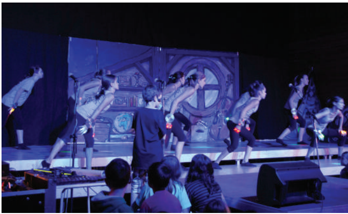
Der Robottanz ... ziemlich cool